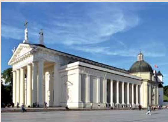
Vilniaus katedra / Katedra w Wilnie