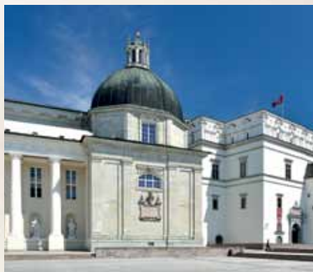
Šv. Kazimiero koplyčia pietiniame Vilniaus katedros kampe / Kaplica św. Kazimierza w południowym rogu katedry wileńskiej