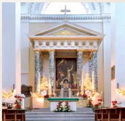
Vilniaus arkikatedros bazilikos Didysis altorius / Oltarz główny bazyliki archikatedralnej w Wilnie