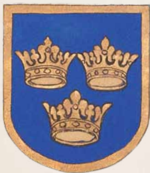
Krokuvos kapitulės herbas – polichromija iš Vavelio katedros kapitulės salės, XX a. pr. / Herb Krakowskiej Kapituły Katedralnej – polichromia z Kapitułarza katedry na Wawelu, pocz. XX w.

(archi)katedralnej: między sacrum a profanum