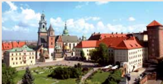
Krokvos katedra ir Vavelio karališkoji pilis nuo Sandomiero bokšto / Widok na katedrę i Zamek Królewski na Wawelu z baszty Sandomierskiej