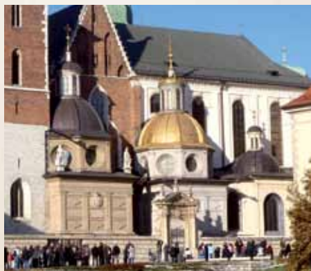
Vazų ir Žygimantų koplyčios prie pietinio įėjimo į Krokuvos katedrą / Kaplica Wazów oraz Kaplica Zyguntowska przy południowym wejściu do katedry na Wawelu