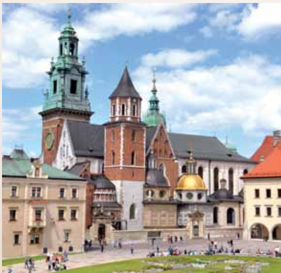
Krokuvos Vavelio katedra / Katedra na Wawelu w Krakowie