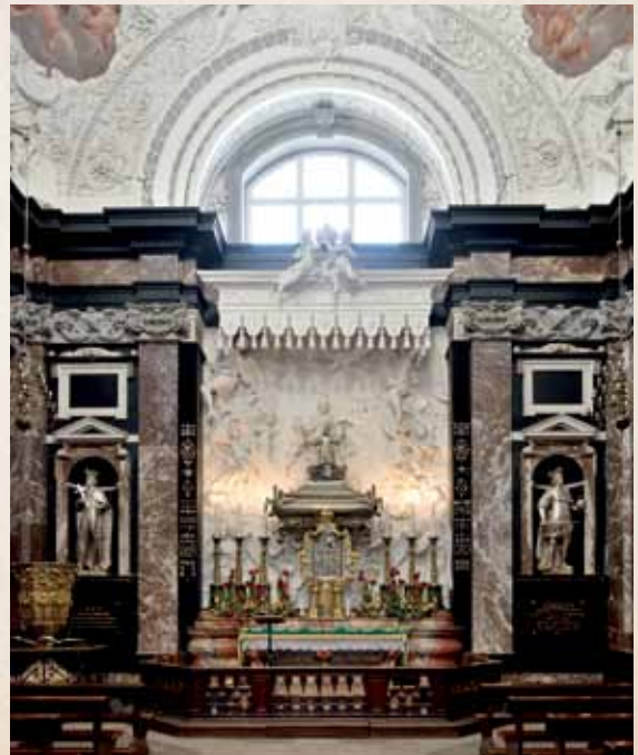
Šv. Kazimiero koplyčios altorius su Lietuvos ir Lenkijos globėjo sarkofagu / Oltarz w kaplicy św. Kazimierza z sarkofagiem patrona Litwy i Polski