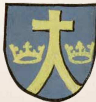
Vilniaus kapitulės herbas, XV a. I p. /

Herb Wileńskiej Kapituły Katedralnej, 1. poł. XV w.