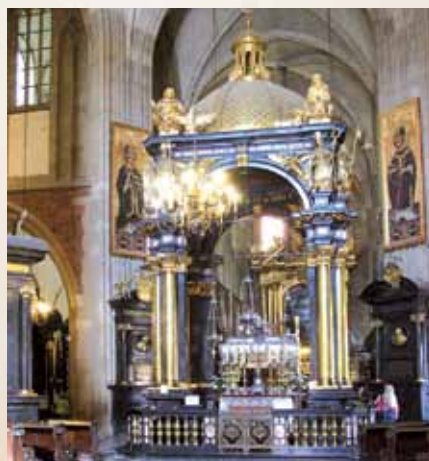
Krokuvos Vavelio katedros Ara Patriae – Tėvynės altorius / Oltarz Ojczyzny – Ara Patriae – w katedrze wawelskiej