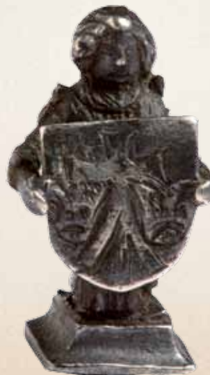
Angelas, laikantis skydelį su Vilniaus katedros kapitulos herbu, XV a. – XVI a. pr. / Anioł trzymający tarczę z herbem Wileńskiej Kapituły Katedralnej, XV w. – pocz. XVI w. Bažnytinio paveldo muziejus, Vilnius