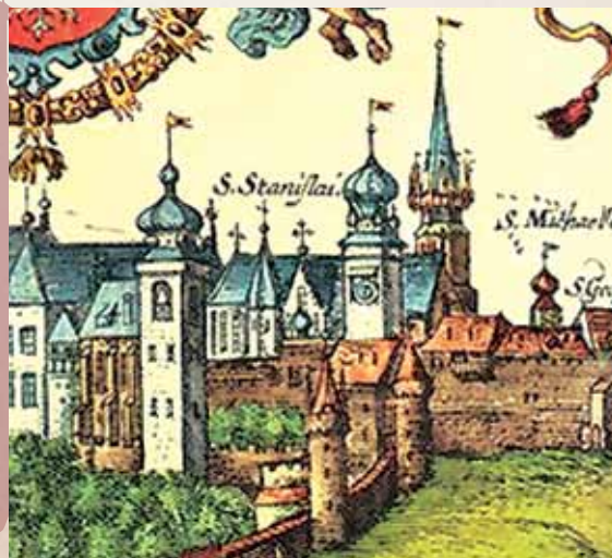
Wawelio katedra XVI a. pab. /

Tematykę z zakresu dziejów katedr krakowskiej i wileńskiej podejmowano wielokrotnie, ale nigdy w powiązaniu ze sobą. Oba kościoły odegrały i odgrywają nadal znaczącą rolę w kształtowaniu świadomości narodowej Litwinów i Polaków, ich kultury politycznej, dawnych i współczesnych tradycji państwowych. Więzy między tymi kościołami katedralnymi występowały na poziomie ordynariuszy diecezji oraz kapituł katedralnych, a ich decyzje miały dalekosiężne skutki geopolityczne, gospodarcze i kulturowe. Tymczasem liczne kwestie badawcze dotyczą w równym stopniu obu świątyń ulokowanych w dwóch stołecznych miastach Rzeczypospolitej Obojga Narodów, tj. Królestwa Polskiego i Wielkiego Księstwa Litewskiego. Postawienie względem nich tych samych pytań oraz wskazanie na podobieństwa i różnice między nimi może przynieść zupełnie nowe i nieoczekiwane wyniki. Zakres tematyczny konferencji wymaga udziału specjalistów z różnych dziedzin – historii i nauk pomocniczych historii, historii sztuki, literaturoznawstwa, kulturoznawstwa i in., co zapewni szerokie i wieloaspektowe ujęcie problematyki wiążącej się z ponad 600-letnim okresem współistnienia dwu najważniejszych świątyń Litwy i Polski.