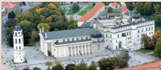
Vilniaus katedra ir Lietuvos didžiųjų kunigaikščių rūmai iš paukščio skrydžio / Katedra wileńska i pałac wielkich książąt litewskich z lotu ptaka

Vilniaus vyskupystės susikūrimas 1390–1391 m. / Powstanie biskupstwa wileńskiego w 1390–1391 roku